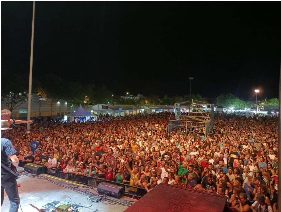
Explanada conciertos sin graderío (Parla)

En función de las capacidades técnicas y económicas, dicho recinto puede ser tan simple como pavimentar el suelo o incluso dotarlo de graderío como es el caso de, por ejemplo, el Auditorio Municipal Ruta de la Plata en Zamora: